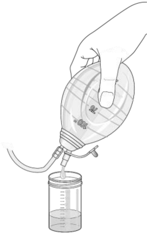
الشكل 2: تفريغ القارورة