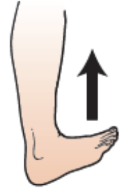
الشكل 13. توجيه أصابع القدم للأعلى