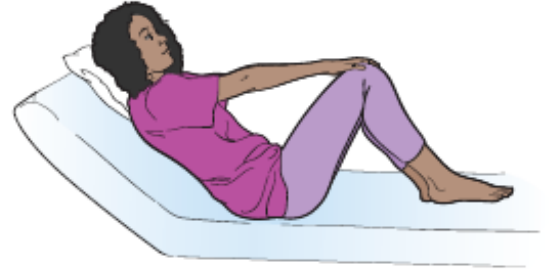
الشكل 8. مد ذراعيك