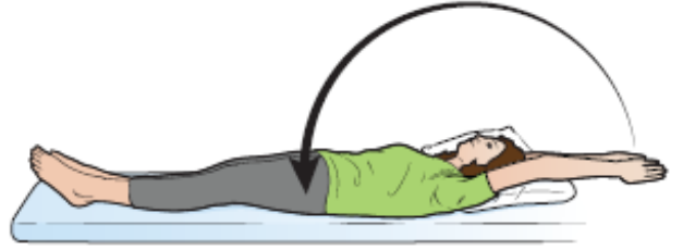
الشكل 11. مد الذراعين للأعلى