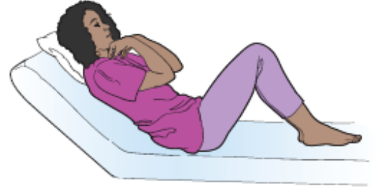
الشكل 9. لمس كتفيك