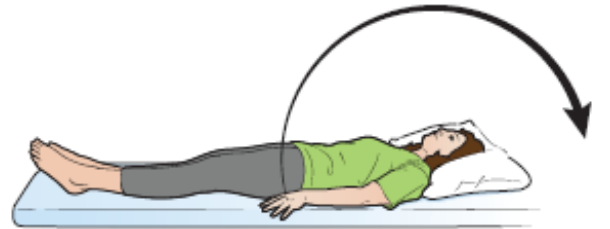
الشكل 10. كلا الذراعين على الجانبين