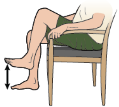
الشكل 15. المشي في المكان