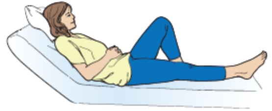
الشكل 6. ثني الساق