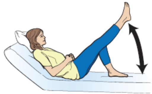
الشكل 7. رفع الساق