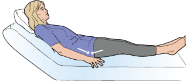
الشكل 4. مجموعات الأرداف