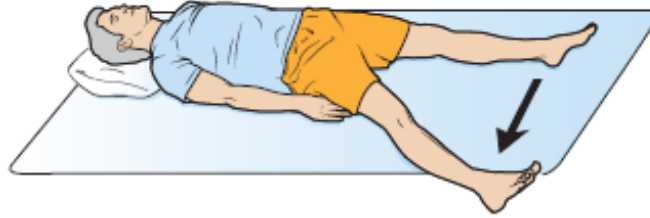
الشكل 5. تقوية العضلة الضامة