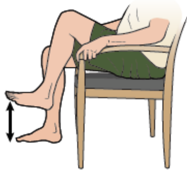
الشكل 3. المشي في المكان