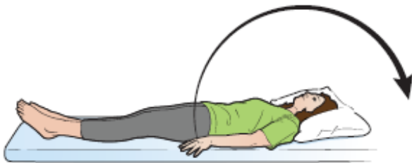
الشكل 6. الذراعان على الجانبين