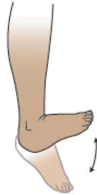
الشكل 2. تمارين الكاحل