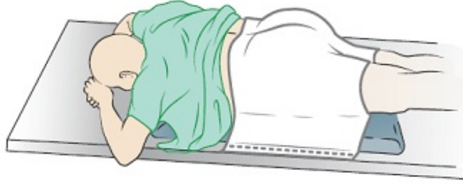
الشكل 2. قالب التثبيت

إذا كانت لديك أداة تثبيت، فسوف تستخدمها أثناء المداواة وخلال جميع جلسات العلاج. وربما يتم تثبيتها على طاولة المداواة أو العلاج، بناءً على وضعيتك. يسعدك هذا في المداوفة على الوضعية المطلوبة خلال كل علاج.