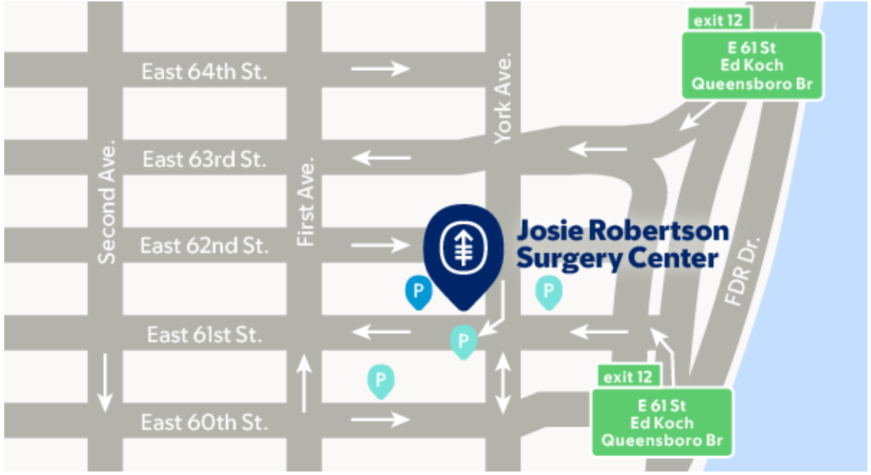
চিত্র 1. MSK-এর পাকিং গ্যারেজ (নীল) এবং কাছাকাছি অন্যান্য গ্যারেজ (টিল)