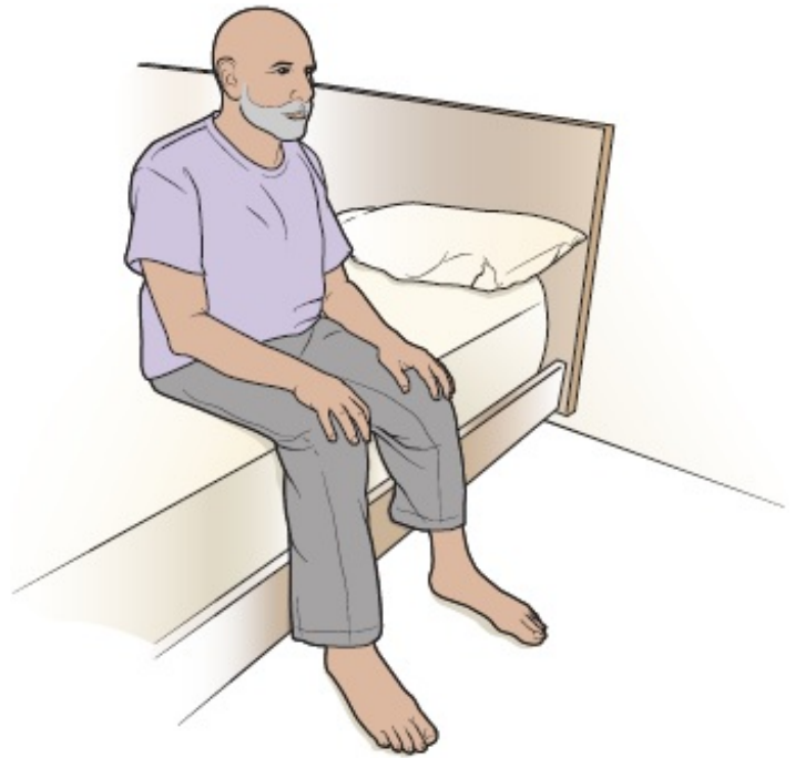
Abbildung 3. Sitzen auf dem Bettrand

Sie können in jeder Position schlafen, die Ihnen keine Beschwerden verursacht. Viele Personen liegen am liebsten auf der Seite.