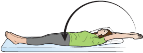
Εικόνα 11. Τεντωμένα χέρια πάνω από το κεφάλι