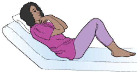
Εικόνα 9. Αγγίζοντας τους ώμους σας