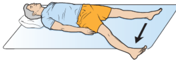
Εικόνα 5. Ενίσχυση απαγωγών