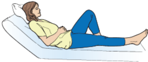
Εικόνα 6. Λύγισμα του ποδιού σας