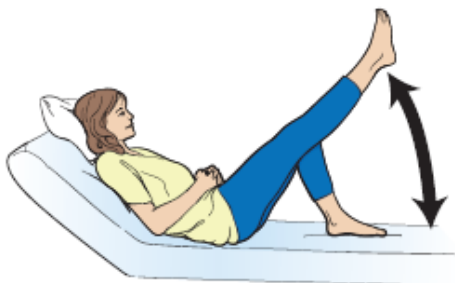
Εικόνα 7. Άρση του ποδιού σας