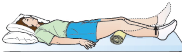
Εικόνα 2. Κυλήσεις γονάτου