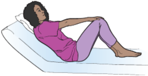
Εικόνα 8. Τεντώνοντας τα χέρια σας προς τα έξω