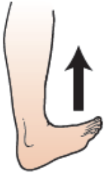
Εικόνα 13. Στρέψη των δακτύλων προς τα επάνω