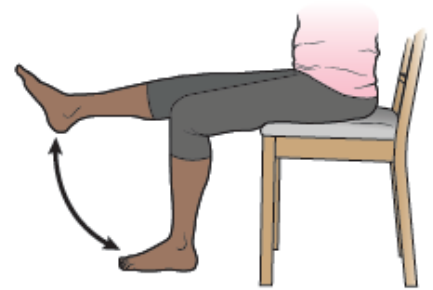
Εικόνα 16. Κλωτσιά προς τα πάνω

Εάν έχετε ερωτήσεις ή προβληματισμούς, επικοινωνήστε με τον πάροχο υγειονομικής περίθαλψής σας. Ένα μέλος της ομάδας περίθαλψής σας θα απαντά Δευτέρα με Παρασκευή από 9 π.μ. έως 5 μ.μ. Πέραν των ωρών αυτών, μπορείτε να αφήσετε ένα μήνυμα ή να μιλήσετε με κάποιον άλλο πάροχο της MSK. Υπάρχει πάντα διαθέσιμος ένας γιατρός ή νοσηλεύτης. Εάν δεν είστε σίγουρος/η πώς να επικοινωνήσετε με τον πάροχο υγειονομικής περίθαλψής σας, καλέστε το 212-639-2000.