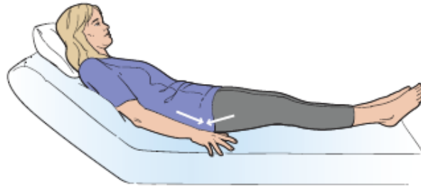
Εικόνα 4. Σετ για τους γλουτούς