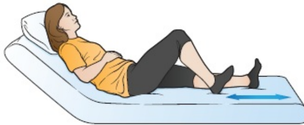
Εικόνα 1. Ρολάρετε τις φτέρνες Ξαπλωμένοι