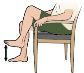
Εικόνα 15. Στατικό βάδισμα