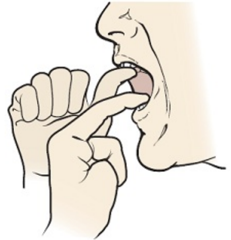
Εικόνα 5. Χρησιμοποιήστε τα δακτυλά σας για να δώσετε επιπλέον αντίσταση