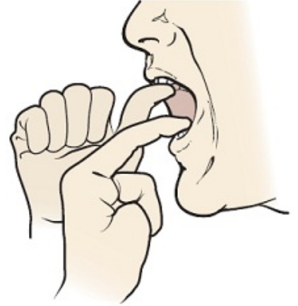
Εικόνα 5. Χρησιμοποιήστε τα δακτυλά σας για να δώσετε επιπλέον αντίσταση

Ο ειδικός κατάποσής σας μπορεί να παρατηρήσει αλλαγές στην ικανότητά σας να καταπιείτε. Εάν συμβεί κάτι τέτοιο, μπορεί να σας μάθει άλλες ασκήσεις ή άλλους τρόπους για να βοηθηθείτε να συνεχίσετε να καταπίνετε κατά τη διάρκεια της θεραπείας σας.