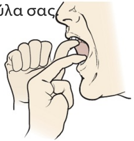
Εικόνα 5. Χρησιμοποιήστε τα δάκτυλά σας για να δώσετε επιπλέον αντίσταση

Η καλή διατροφή είναι σημαντικό μέρος της αντικαρκινικής σας θεραπείας. Εάν πονάτε ή