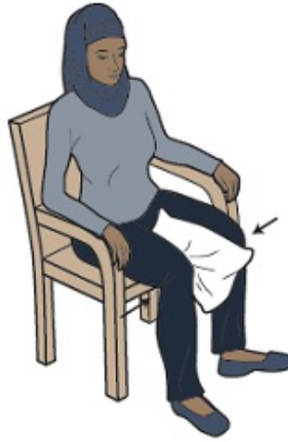
Εικόνα 8. Πιέσεις σε μαξιλάρι σε καθιστή θέση