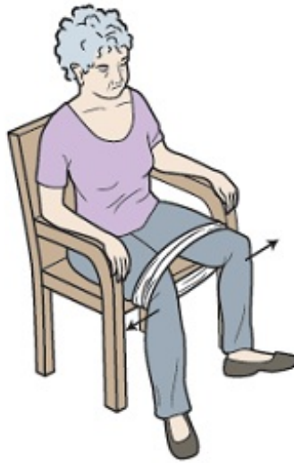
Εικόνα 7. Ενίσχυση απαγωγών σε καθιστή θέση με ελαστικό ιμάντα