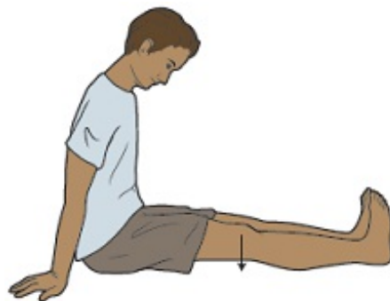
Εικόνα 3. Σετ για τους τετρακέφαλους