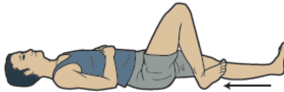
Εικόνα 6. Ρολάρετε τις φτέρνες ξαπλωμένοι