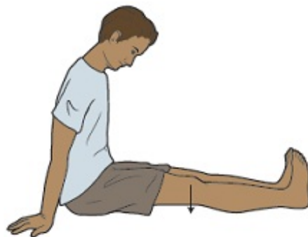
Εικόνα 3. Σετ για τους τετρακέφαλους