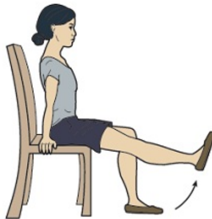
Εικόνα 9. Κλωτσιές σε καθιστή θέση