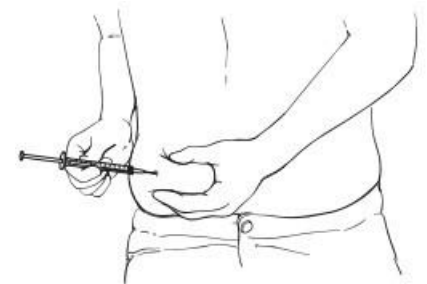
Figura 2. Darse la inyección