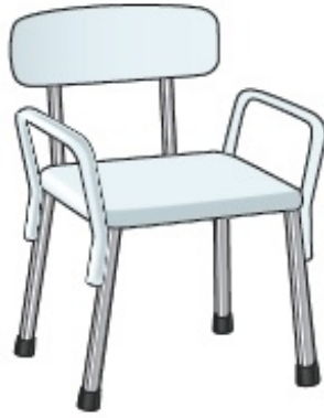
Figura 2. Silla para ducha con brazos y respaldo