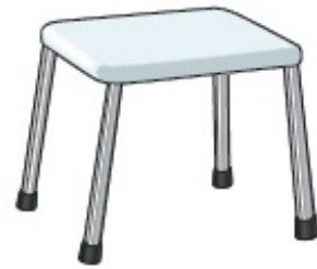
Figura 4. Silla para ducha sin respaldo ni brazos