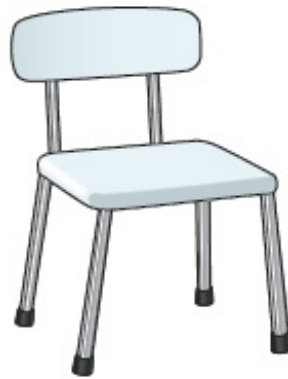
Figura 3. Silla para ducha con respaldo