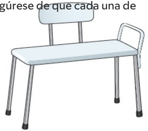
Figura 5. Banco para bañera

poco más de la mitad de él quede dentro de la bañera. Asegúrese de que cada una de las patas quede fija en su sitio de modo que el banco no se deslice. Deje espacio suficiente para las piernas en la parte delantera del banco.