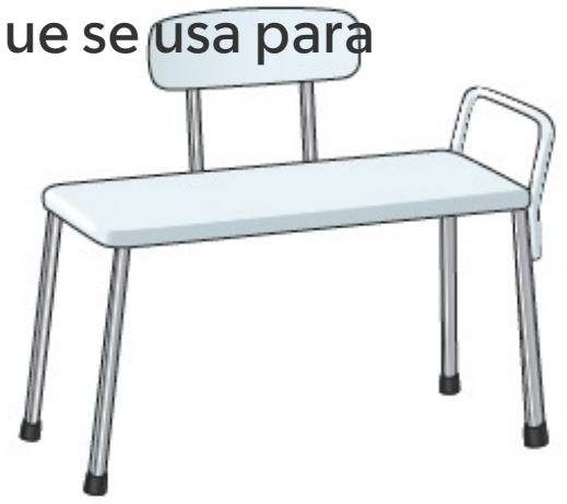
Figura 5. Banco para bañera

Un banco para bañera es un asiento que se usa para ayudarle a entrar y salir de la ducha o la bañera. Es útil para las personas que tienen problemas para levantar las piernas a fin de entrar en la bañera. El banco tiene tapones de goma o ventosas en la parte inferior de cada pata (véase la figura 5). Estas le ayudan a moverse de forma segura y fácil al evitar que el banco se deslice dentro de la bañera.