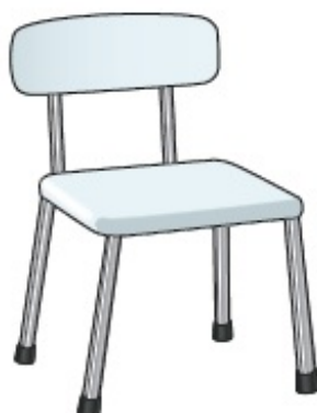
Figura 3. Silla para ducha con respaldo