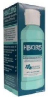
Limpiador dérmico Hibiclens

Hibiclens es un limpiador dérmico que mata los gérmenes durante 24 horas después de usarlo (véase la figura). Ducharse con Hibiclens antes de su cirugía ayudará a reducir el riesgo de infección después de su cirugía. Puede comprar Hibiclens en la farmacia local sin receta.