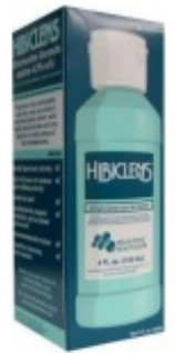
Limpiador dérmico Hibiclens

Hibiclens es un limpiador dérmico que mata los gérmenes durante 24 horas después de usarlo (véase la figura). Ducharse con Hibiclens antes de la cirugía ayudará a reducir el riesgo de infección después de la cirugía. Puede comprar Hibiclens en la farmacia local sin receta.