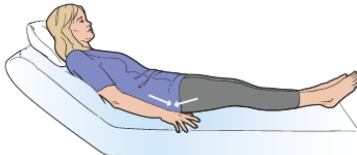
Figura 3. Series de glúteos

Haga este ejercicio cada una hora mientras esté despierto.