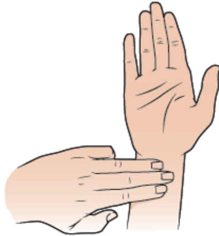
Figura 1. Colocar 3 dedos sobre la muñeca

interior de la muñeca justo debajo del dedo índice (véase la figura 2). Debe poder sentir 2 tendones grandes (tejido que conecta los músculos con los huesos), debajo del pulgar. Éste es el punto de presión P-6.