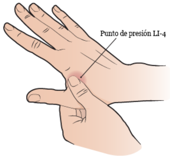
Figura 2. Cómo encontrar el espacio entre el pulgar y el dedo índice