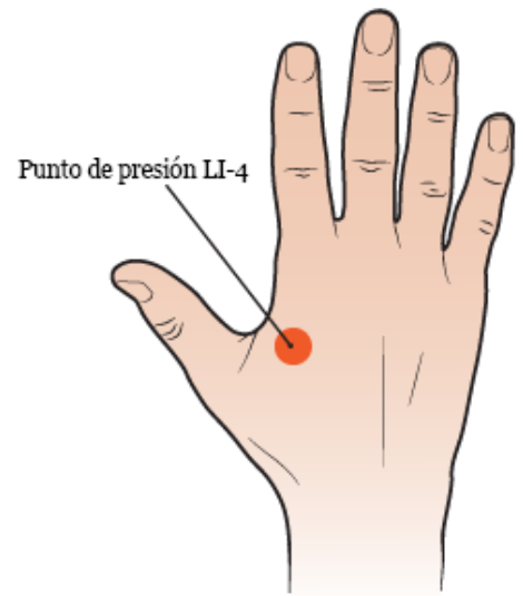
Figura 1. Punto de presión LI-4 en el dorso de la mano