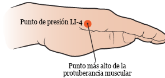
Figura 3. Cómo encontrar el punto más alto de la protuberancia muscular