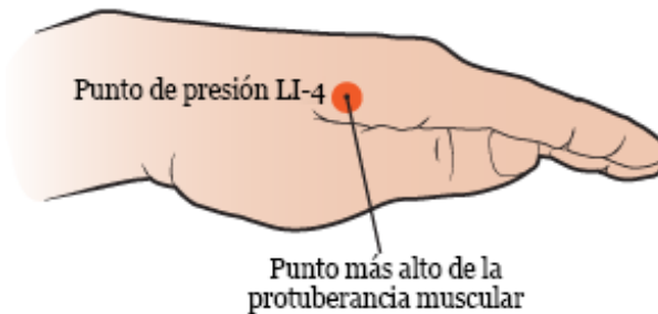
Figura 3. Cómo encontrar el punto más alto de la protuberancia muscular