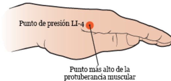
Figura 3. Cómo encontrar el punto más alto de la protuberancia muscular