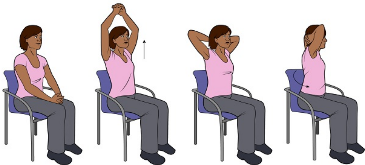
Figura 2. Estiramiento axilar