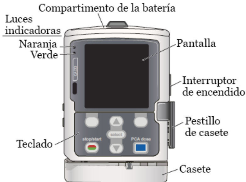
Figura 1. Bomba CADD-Solis VIP

La bomba CADD-Solis VIP se conecta al catéter venoso central (CVC). Hay 3 tipos principales de CVC: