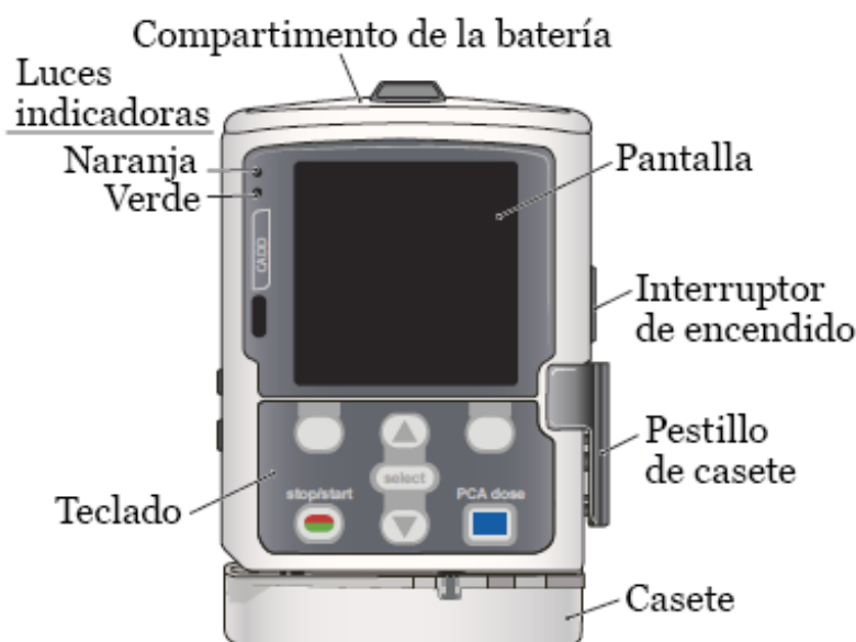
Figura 1. Bomba CADD-Solis VIP

La bomba CADD-Solis VIP es pequeña y funciona a batería. Se utiliza para administrar líquidos, medicamentos y quimioterapia a través de sus venas (véase la figura 1).