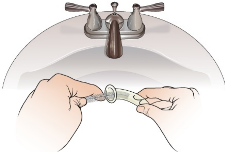
Figura 2. Limpieza del tubo de laringectomía