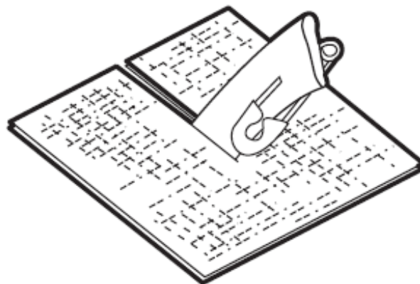
Figura 1. Drenaje Penrose

Tendrá parte de su drenaje Penrose dentro del cuerpo. Un extremo de su drenaje o ambos saldrán de su incisión. Algo de sangre y líquido saldrá por su drenaje y caerá en un vendaje (tiritas de gasa) que estará alrededor de aquel. Por lo general, se deja un alfiler de seguridad o una lengüeta pequeña al final del drenaje para evitar que se introduzca en la herida (véase la figura 1).