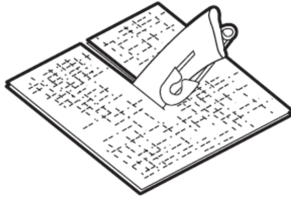
Figura 1. Drenaje Penrose

El tiempo durante el cual tendrá el drenaje depende de la cirugía y de la cantidad de líquido que sale de la incisión. A medida que la incisión cicatriza, tendrá menos líquido. Cuando no salga líquido de su drenaje Penrose durante 24 horas, comuníquese con su médico para programar una cita para retirarlo.