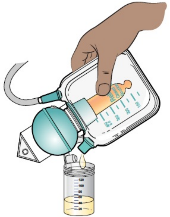
Figura 3. Vaciado del drenaje ReliaVac