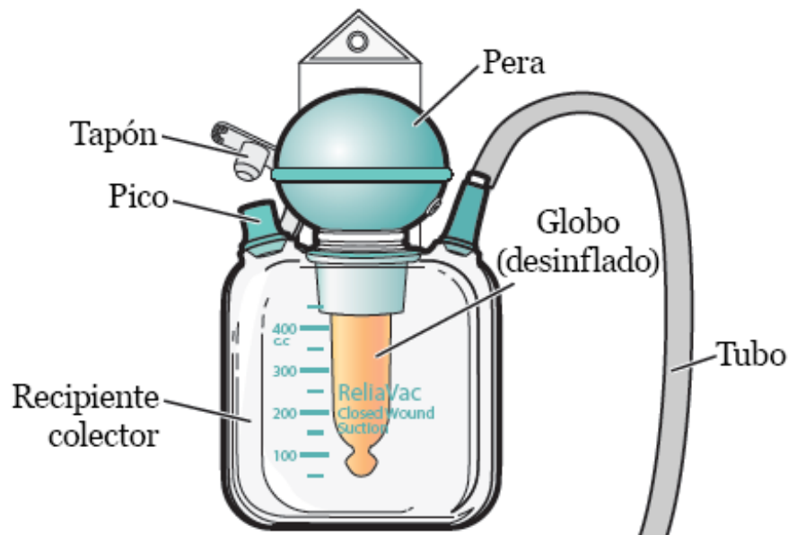
Figura 1. Drenaje ReliaVac

El drenaje ReliaVac es un recipiente de recolección de plástico transparente con un globo adentro (véase la figura 1). Se conecta a un tubo con un conector con forma de Y en el extremo. El otro lado del conector con forma de Y está unido a un catéter (sonda delgada), que se coloca cerca de su incisión.