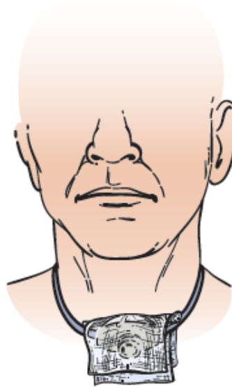
Figura 4. Gasa humedecida colocada sobre la abertura del tubo de traqueostomía

5. Abra la gasa y colóquela sobre la cuerda. Coloque la gaza frente a la abertura del tubo de traqueostomía (véase la figura 4). Ate la cuerda con un lazo detrás del cuello para mantenerla en su lugar.