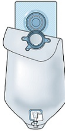
Figura 2. Ajuste la bolsa al disco