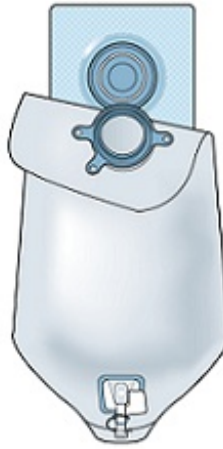
Figura 2. Ajuste la bolsa al disco