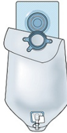
Figura 2. Ajuste la bolsa al disco