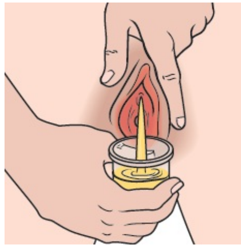
Figura 3. Orinar en el recipiente para la orina