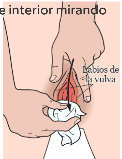
Figura 1. Limpieza de la zona entre los labios de la vagina