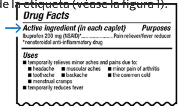
Figura 1. Ingredientes activos en la etiqueta de un medicamento sin receta

medicamentos con receta enumeran sus ingredientes activos en la etiqueta. El nombre de los ingredientes activos es el mismo que el del medicamento genérico.