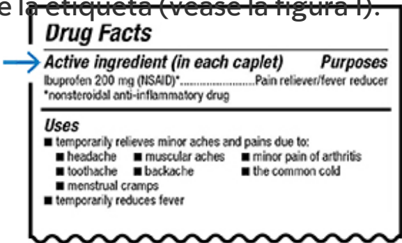
Figura 1. Ingredientes activos en la etiqueta de un medicamento sin receta

medicamentos con receta enumeran sus ingredientes activos en la etiqueta. El nombre de los ingredientes activos es el mismo que el del medicamento genérico.