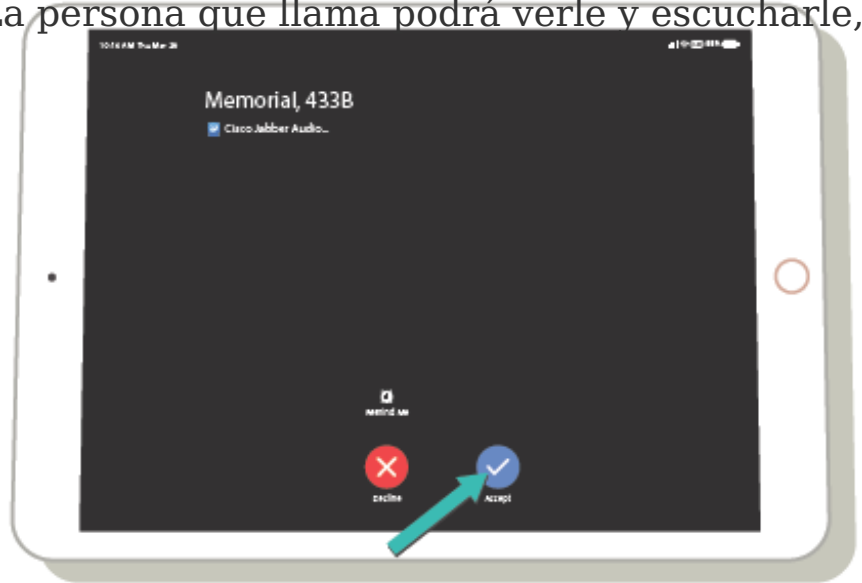
Figura 3. iPad con videollamada entrante

llama en la pantalla del iPad. La persona que llama podrá verle y escucharle, y hablar con usted como es habitual. Asegúrese de sostener el iPad de manera que se pueda ver su cara.