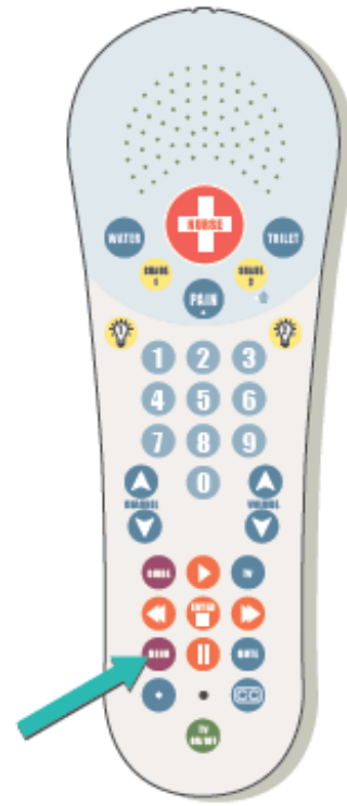
Figura 2. El botón “Menu” en su control remoto

Para responder una videollamada, presione el botón “Menu” en su control remoto (véase la figura 2). Usted verá quién llama en la TV y le escuchará a través del altavoz en el control remoto. La persona que llama también podrá verle y escucharle. Puede hablar como es habitual.