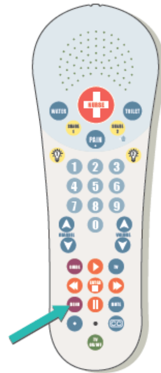
Figura 2. El botón “Menu” en su control remoto

Para responder una videollamada, presione el botón “Menu” en su control remoto (véase la figura 2). Usted verá quién llama en la TV y le escuchará a través del altavoz en el control remoto. La persona que llama también podrá verle y escucharle. Puede hablar como es habitual.