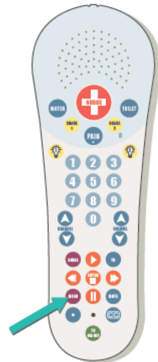
Figura 2. El botón “Menu” en su control remoto

Para responder una videollamada, presione el botón “Menu” en su control remoto (véase la figura 2). Usted verá quién llama en la