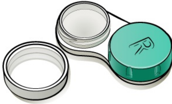
Figura 1. Estuche de lentes de contacto para soluciones multipropósito