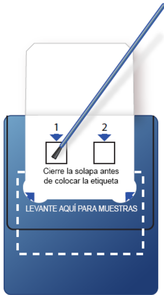
Figura 3. Frote el cepillo por el interior del cuadrado marcado “1”