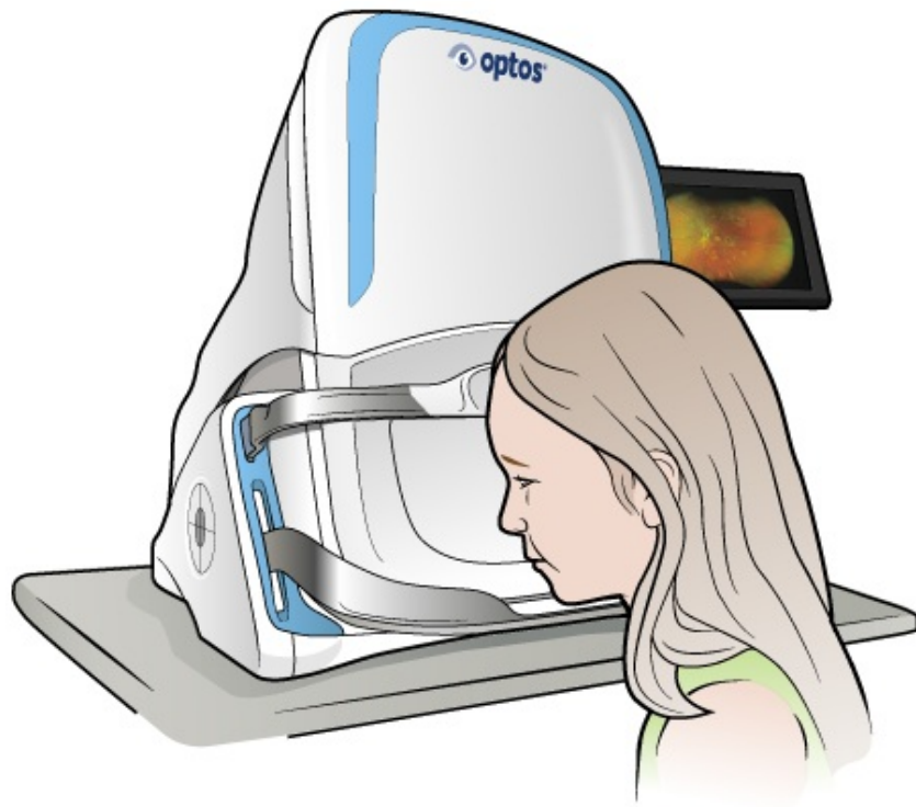
Figura 2. La máquina Optos

Si su niño también necesita una ecografía, usted y él pasarán a la sala de exámenes. El enfermero colocará un gel frío en los párpados de su niño y luego utilizará la sonda de ultrasonido, que tiene la forma de una varita, para masajear alrededor de los ojos. La sonda explorará y tomará fotografías de los ojos del niño; sentirá una presión leve, pero no dolor.