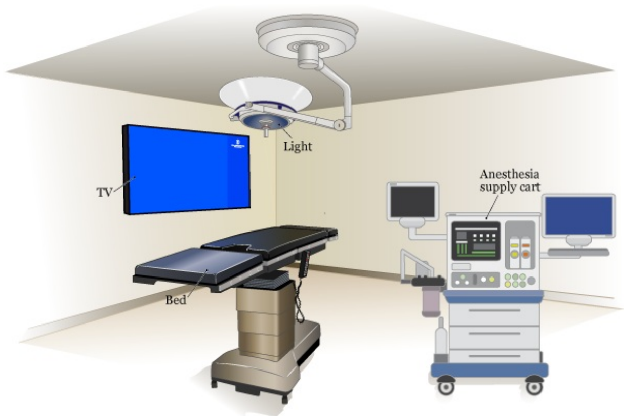
Figura 1. Sala de exámenes