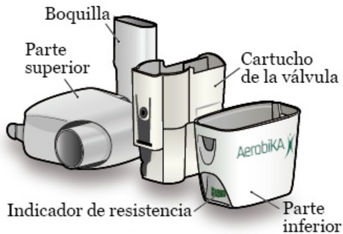
Figura 2. Desmonte su Aerobika