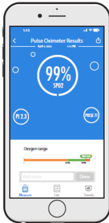
Figura 5. Resumen de resultados en la aplicación