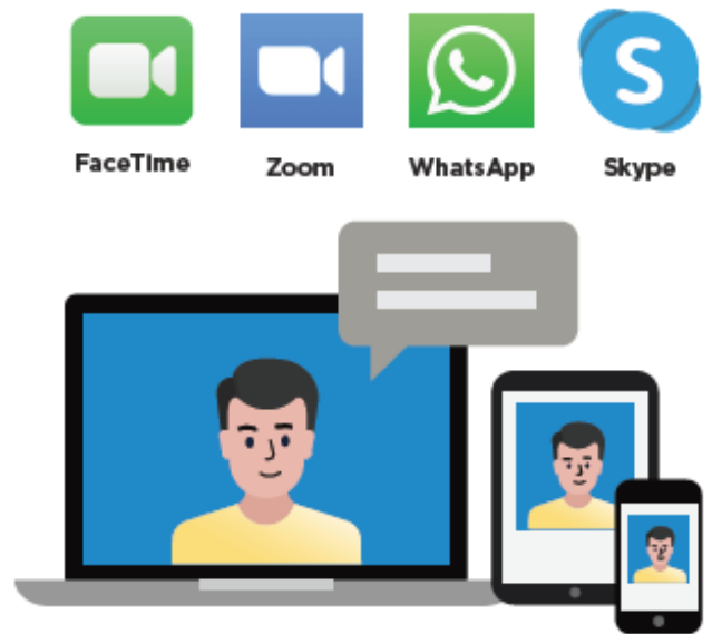
Figura 4. Videollamadas desde su computadora o dispositivo inteligente

Es mejor hacer esto antes de la cita del paciente. De esa manera, estará listo para responder cuando le llamen durante su cita (véase la figura 4).