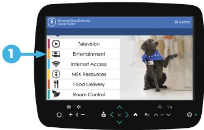
Figura 1. Selección “Entertainment” (Entretenimiento)