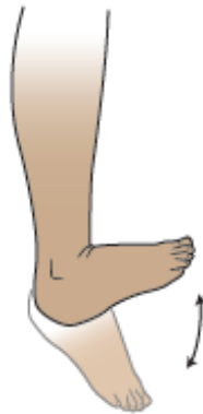
Figura 2. Bombeo de tobillo