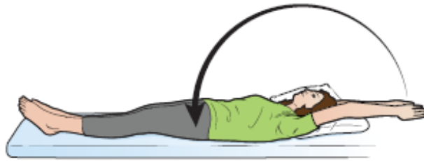
Figura 7. Brazos sobre la cabeza