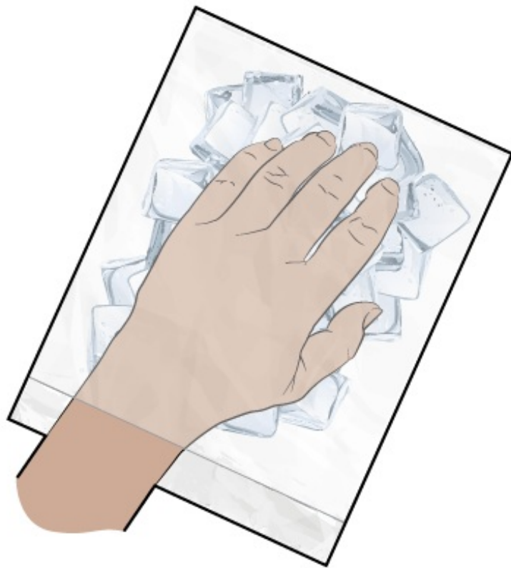
Figura 2. Durante el enfriamiento de las uñas

Su enfermero y otros integrantes de su equipo de atención médica le envolverán las manos, los pies o ambos con compresas frías o bolsas de hielo, al menos 15 minutos antes de comenzar la quimioterapia (véase la figura 2). El hielo permanecerá en su lugar durante el tratamiento y se lo quitarán 15 minutos después de terminar la quimioterapia. Es posible que se tenga que cambiar el hielo durante el tratamiento si comienza a derretirse. Es importante mantener el hielo durante el tiempo recomendado para que se pueda beneficiar completamente