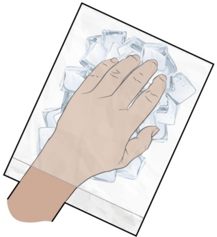
Figura 2. Durante el enfriamiento de las uñas

Los estudios han demostrado que las personas que usan el enfriamiento de las uñas tienen menos cambios en las uñas que las personas que no lo hacen. También hay investigaciones nuevas que sugieren que el enfriamiento de las manos y los pies puede contribuir a prevenir la neuropatía periférica. Los efectos son diferentes para cada persona, por lo que es difícil predecir cómo le afectará a usted. Sin embargo, el enfriamiento de las uñas es seguro y tiene pocos riesgos.