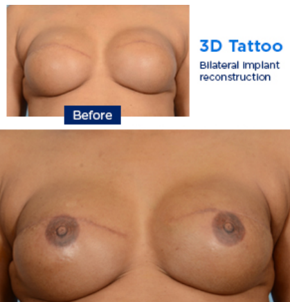
Tatuaje en 3D: reconstrucción bilateral con implantes

Esta página tiene fotos médicas gráficas de mamas con tatuajes de areola y pezón. Son fotos de pacientes antes y después de que someterse al procedimiento. Los médicos asistentes de MSK están capacitados para hacer tatuajes de pezones y areolas para las personas a las que se los extirparon durante una cirugía de cáncer de mama.