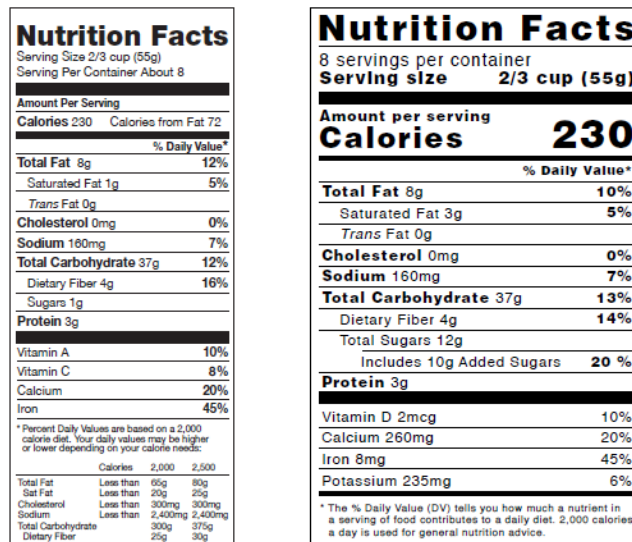
Figura 4. Etiquetas de alimentos

Los siguientes son algunos ejemplos de etiquetas de alimentos (véase la figura 4).