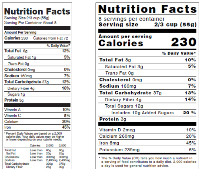
Figura 4. Etiquetas de alimentos

Los siguientes son algunos ejemplos de etiquetas de alimentos (véase la figura 4).