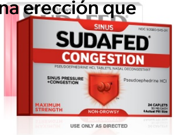
Figura 4. Pseudoephedrine HCl