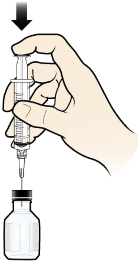
Figura 1. Inyectar aire en el frasco