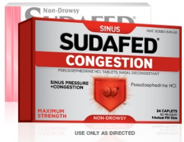
Figura 4. Pseudoephedrine HCl

Tome la tarjeta para adquirir pseudoephedrine HCl, la cual se encuentra en el estante del farmacéutico (véase la figura 4). Deberá mostrar una identificación con foto antes de que el farmacéutico le entregue la caja para comprar.