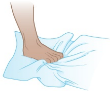
Figura 3. Flexiones de los dedos de los pies usando una toalla.

1. Coloque una toalla en el piso y párese sobre ella. 2. Sujete la toalla con los dedos de los pies (véase la figura 3). Luego, suelte.