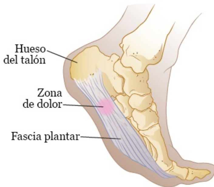
Figura 1. Fascia plantar

La fascia plantar es una banda gruesa de tejido. Conecta el hueso del talón con la bola o parte delantera del pie (véase la figura 1). La fascia plantar actúa como una banda elástica que se estira con cada paso que da. También sostiene el arco del pie.