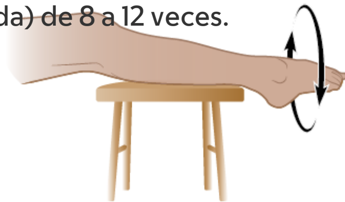
Figura 5. Círculos con los tobillos

If you have questions or concerns, contact your healthcare provider. A member of your care team will answer Monday through Friday from 9 a.m. to 5 p.m. Outside those hours, you can leave a message or talk with another MSK provider. There is always a doctor or nurse on call. If you're not sure how to reach your healthcare provider, call 212-639-2000.