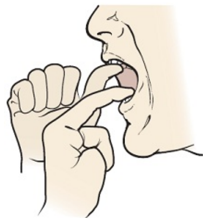
Figura 5. Ayúdese con los dedos para oponer más resistencia

Su especialista en deglución podría notar cambios en su capacidad para tragar. Si así fuera, podría enseñarle otros ejercicios u otras formas para ayudarle a tragar durante su tratamiento.