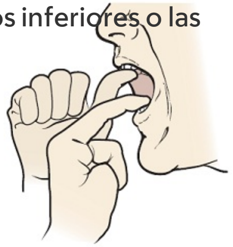
Figura 5. Ayúdese con los dedos para oponer más resistencia

Su especialista en deglución podría notar cambios en su capacidad para tragar. Si así fuera, podría enseñarle otros ejercicios u otras formas para ayudarle a tragar durante su tratamiento.