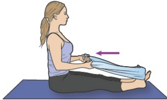
Figura 4. Estiramiento de pantorrilla