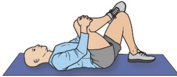
Figura 6. Estiramiento de cadera