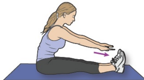
Figura 5. Estiramiento de ligamento de la corva