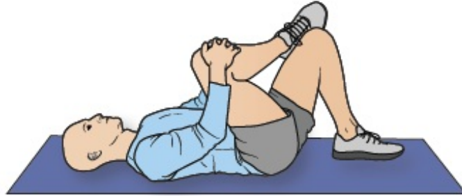
Figura 6. Estiramiento de cadera