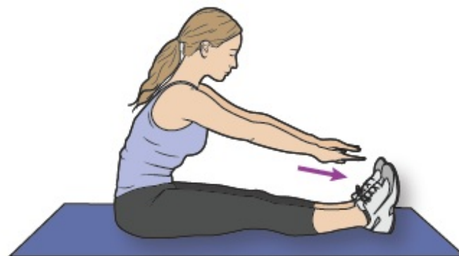
Figura 5. Estiramiento de ligamento de la corva