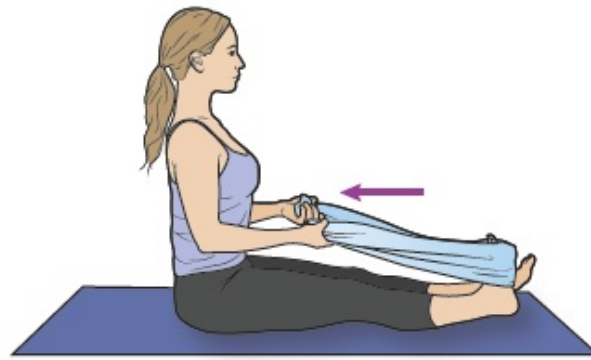
Figura 4. Estiramiento de pantorrilla