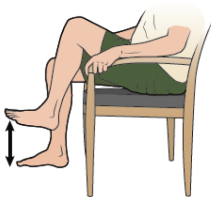
Figura 1. Marchar en el mismo lugar